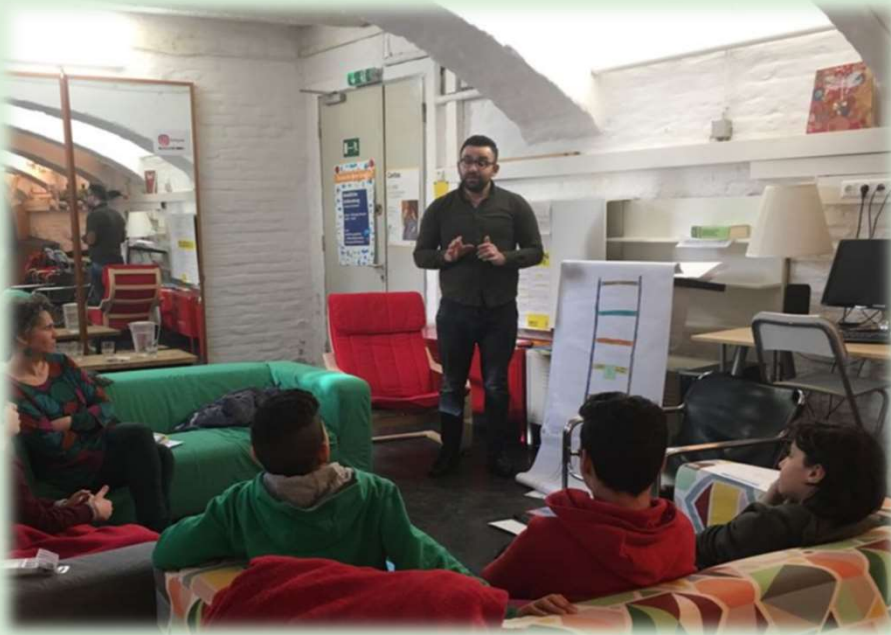
TRT Schulung mit geflüchteten Jungen, April 2018, Wien.